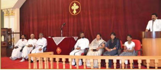
@ YUVAJANA SAKHYAM